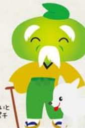
ひめじい 曾太ボチ